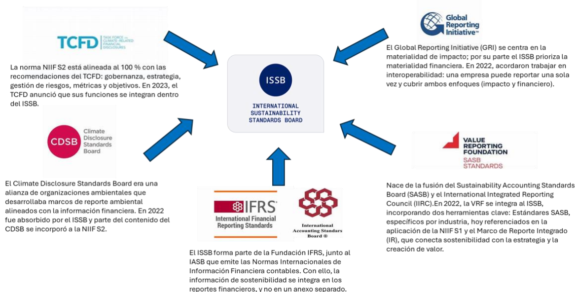
Ilustración 1. Vinculación del International Sustainability Standards Board con otros marcos y estándares.